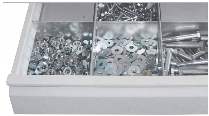
Alle Schubladen individuell einzurichten, siehe Zusatzausstattung.