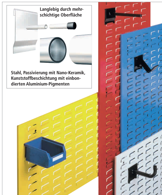
Langlebig durch mehrschichtige Oberfläche