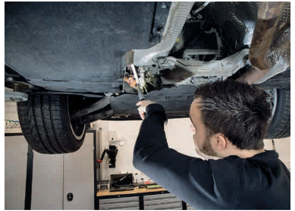
Länge x Ø 357 x 25 mm