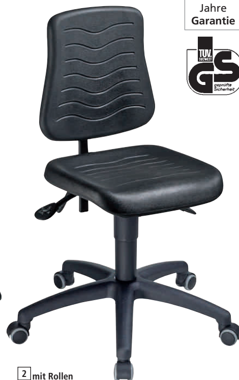
2 mit Rollen