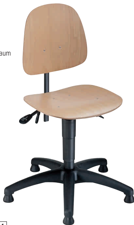
1 mit Gleitern