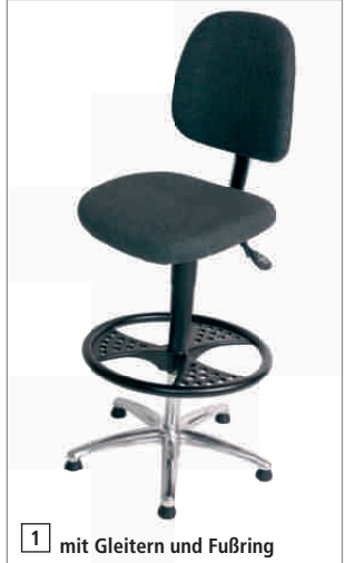
1 mit Gleitern und Fußring