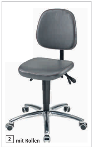
2 mit Rollen