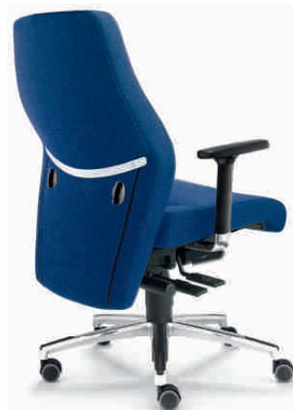
1 ohne Nackenstütze