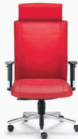
3 extra breit, mit fester Nackenstütze

Sitz und Rückenlehne folgen den Bewegungen des Sitzenden synchron im richtigen Winkelverhältnis. Stufenlose, unmittelbar spürbare Einstellung des Rückenlehnen-Gegendrucks, Synchronbewegung stufenlos arretierbar.