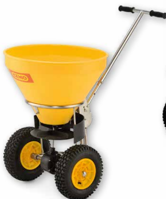
Inhalt 20 Liter