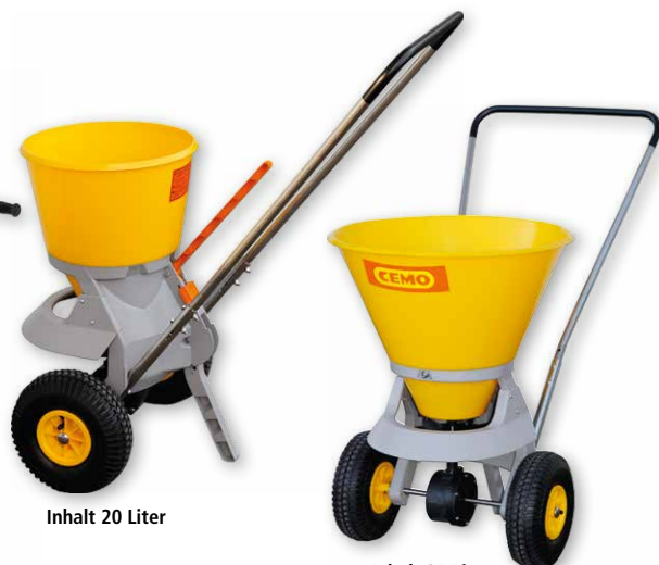
Inhalt 35 Liter