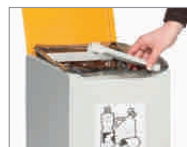
mit praktischen Müllsack-Klemmen