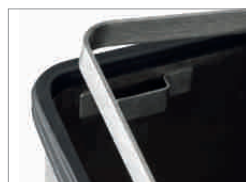
einfach bedienbare Müllsackhalterung