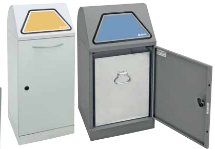
2 handbetätigt und mit verzinktem Innenbehälter