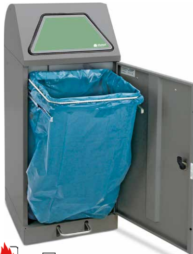
1 mit Fußpedal und ausziehbarem Klemmring