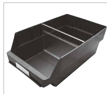
elektrisch leitfähige Ausführung auf Anfrage