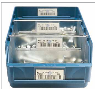
Querteiler für Kasten-Unterteilung als Zubehör