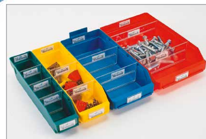
wahlweise in 4 Farben