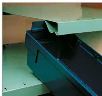
Auszugssperre für das Schrägstellen im Regal als Zubehör