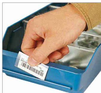
Etiketten mit Schutzfolie für Kästen und Querteiler als Zubehör