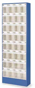
32 x C BF100606 1'692.-