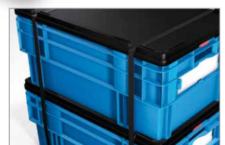
Behälter auch mit Deckel stapelbar