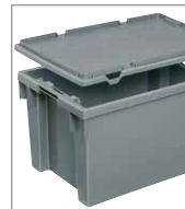
Stülpedeckel zum Schutz des Ladegutes