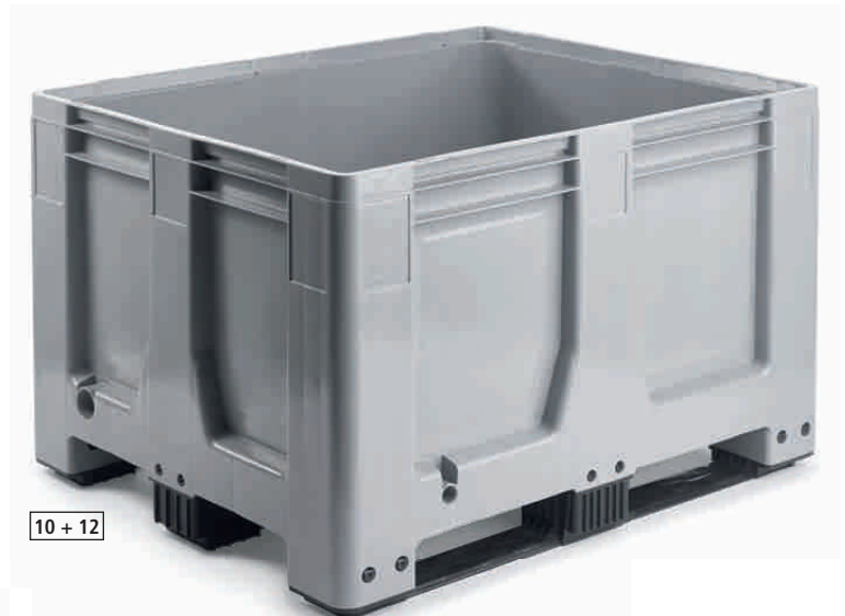
[10 + 12]