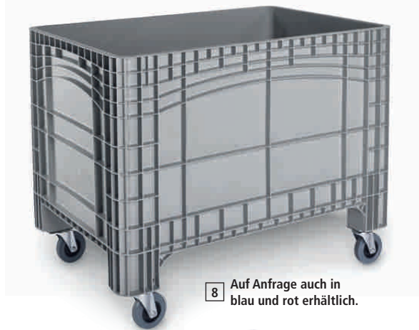
[8] Auf Anfrage auch in blau und rot erhältlich.