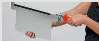
Ausführung 300 x 230 mm inkl. Klemmleiste