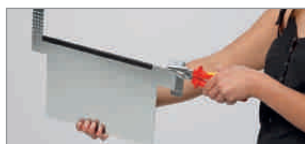
einhängbare Etikettenhalter siehe Seite 375