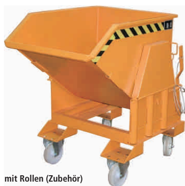
mit Rollen (Zubehör)