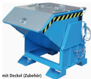
mit Deckel (Zubehör)