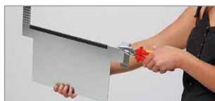
einhängbare Etikettenhalter siehe Seite 391