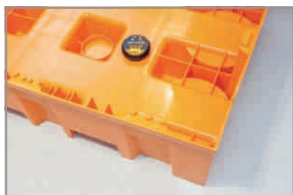
Einsatzbeispiel: in einer Auffangwanne