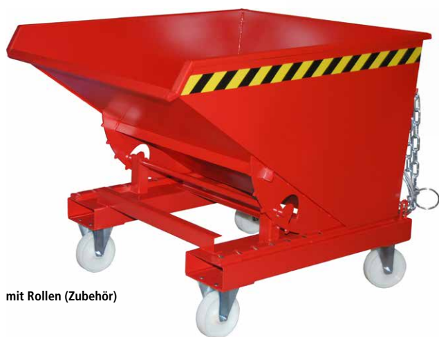
mit Rollen (Zubehör)

Rollen-Satz, Traglast max. 1.350 kg BF518144 395.-