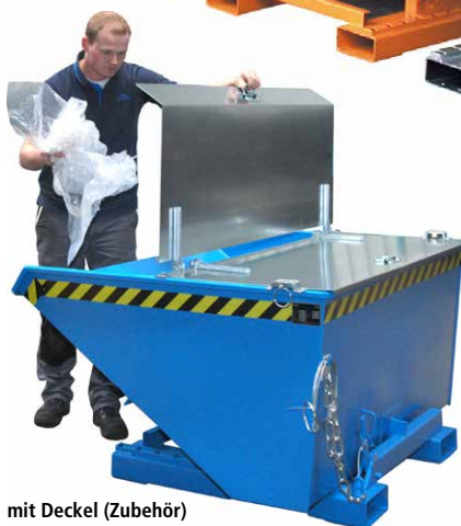
mit Deckel (Zubehör)