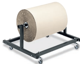
4 Abrollbock ohne Schneidvorrichtung, fahrbar