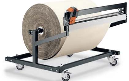
3 Untertischgerät mit 1 Schneidvorrichtung, fahrbar Austritthöhe des Materials 580 mm