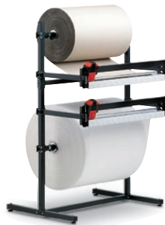
2 mit 2 Schneidvorrichtungen Austritthöhe des Materials stufenlos höhenverstellbar