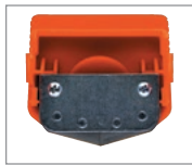
Klingenmesser für Weichfolie