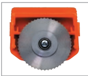
Rundmesser für Papier und Pappe