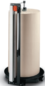
5 Schneidständer, senkrecht fahrbar auf 3 Rollen