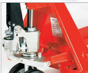
Qualitätshydraulik mit gehärteten, geschliffenen und hartverchromten Kolben