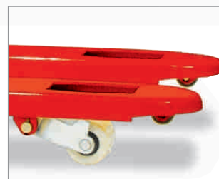
Kletterrollen in den Gabelspitzen für bequeme Einfahrt in quer aufzunehmende Paletten