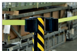
2 Gurte à 22 Meter