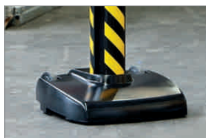
stabiler Standfuß auf Rollen