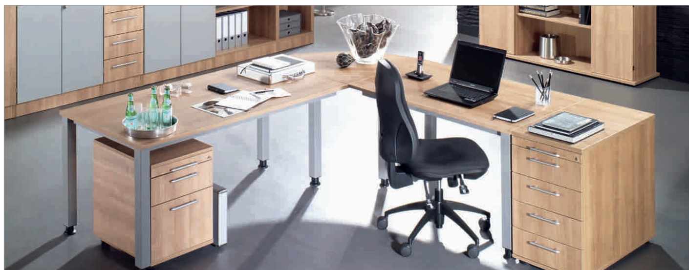
Standcontainer in Schreibtischhöhe zur Vergrößerung der Arbeitsfläche