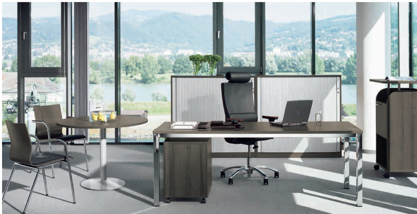
Abb. zeigt Dekor NV- Hikory braun