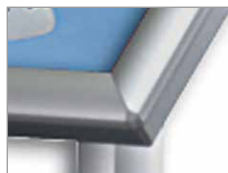
Ecken auf Gehrung