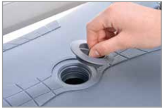
Fußplatte mit Wasser oder Sand befüllbar